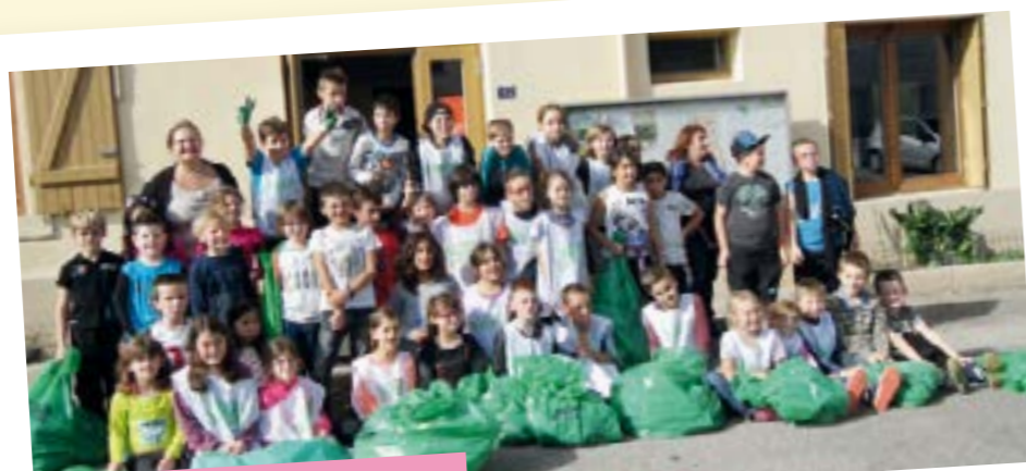
Les enfants font le nettoyage d'automne

Des poubelles ont été mise en place dans tout le village. Merci de les utiliser.