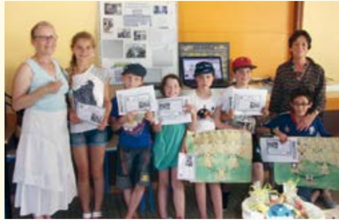
L'atelier de généalogie avec les enfants du périscolaire et les intervenants du Cerle généalogique de Nancy à la salle polyvalente