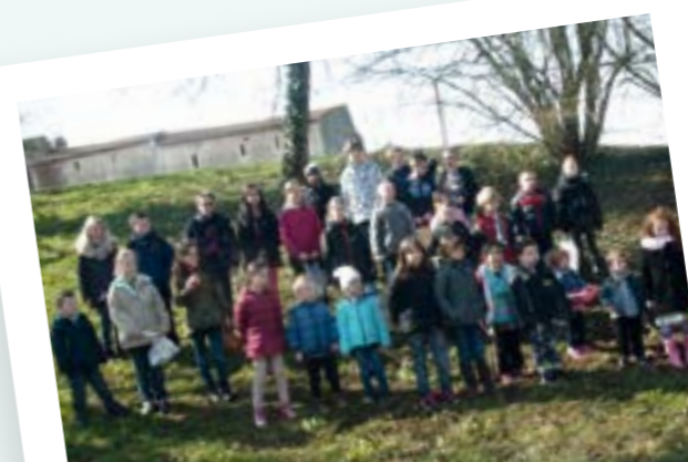
avril 2015 > La chasse aux œufs de Pâques