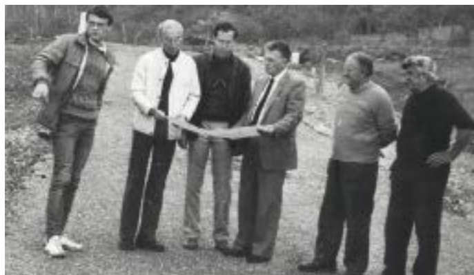
Examen des plans du futur lotissement