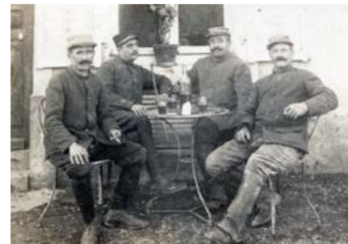
Soldats de Bainville-aux Miroirs 14-18