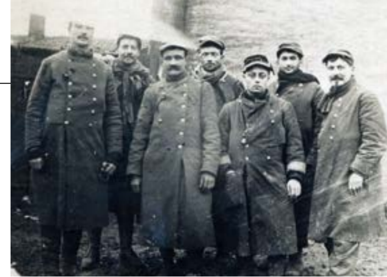
Soldats de Bainville-aux Miroirs 14-18