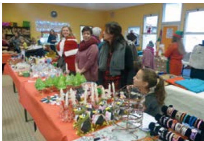
L'association Les Petits Baingrivois et les institutrices au marché de Noël du 29 novembre 2015 à la salle polyvalente

Les dates 2016 : bourse aux vêtements le 16 avril, puce des couturières le 1 er mai, sortie LPO le 15 mai, fête de la musique le 2 juillet, concours de belote le 15 octobre, soirée beaujolais le 5 novembre et le défilé de saint Nicolas le 10 décembre.