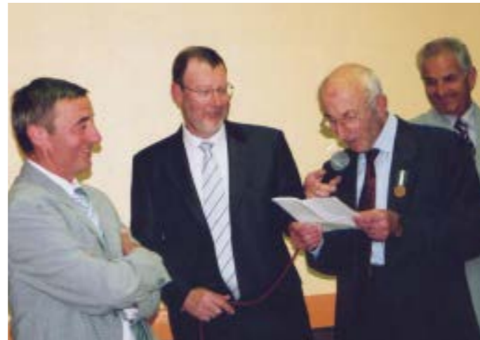
Cérémonie de remise de la médaille communale en 2008