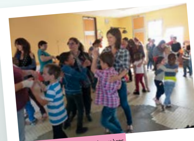
mai 2015 > La fête des mères