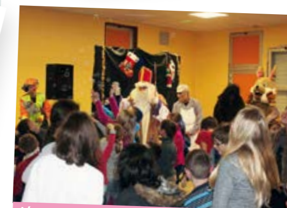
décembre 2015 > Spectacle de magie