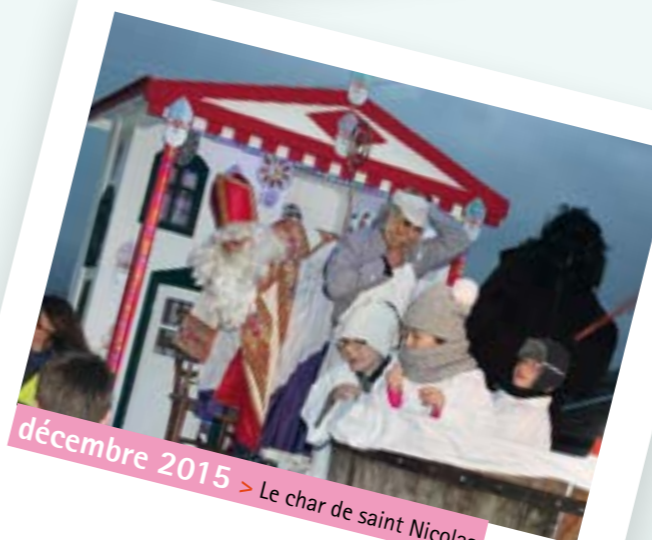
décembre 2015 > Le char de saint Nicolas