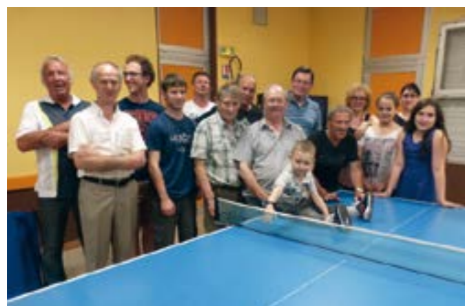
Les adhérents du foyer rural de Bainville-aux-Miroirs et Lebeuville au tennis de table à la salle polyvalente